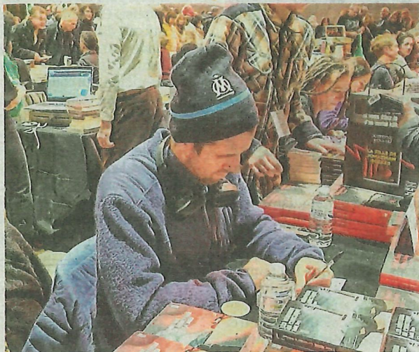
Aslak Nore est aujourd'hui incontournable, auteur notamment de la saga des Falck.

Alors, rien d'étonnant à ce que la 31 e édition du festival Sang d'encre qui s'est ouverte ce samedi 22 novembre et se poursuivra ce dimanche