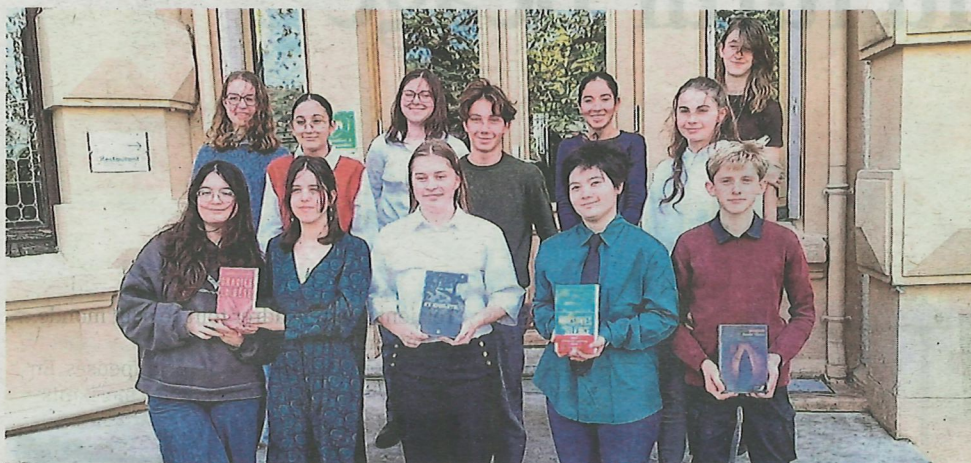
Les membres du jury lycéen à Bellerive.

Depuis 1999, les lycéens viennois se sont associés au festival des littératures policières organisé par la Maison des jeunes et de la culture de Vienne. C'est à cette époque, quatre ans après la naissance de Sang d'encre, qu'a été créé le prix Sang d'encre des lycéens.