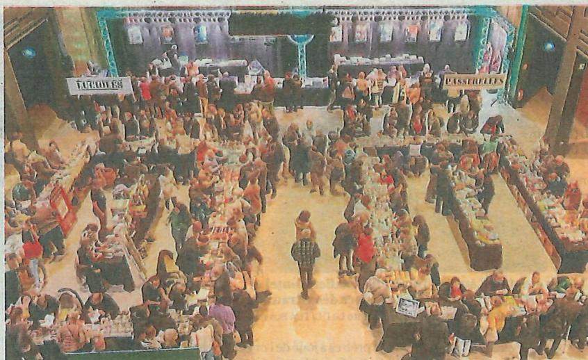
Par passion, par curiosité, par hasard : tout le monde a un mobile pour se rendre à Sang d'encre, salon référence du polar.

La MJC et ses partenaires, les librairies Lucioles et Bulles de Vienne, accueilleront une cin-