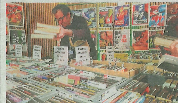
Les polars d'occasion se vendent aussi comme des petits pains avec un stand dédié.