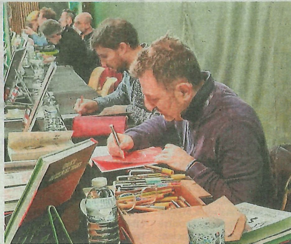
Les auteurs de BD sont aux petits soins pour les dédicaces, bien présents avec toutes leurs couleurs.

Car, comme dans tous les festivals de ce genre, la cerise sur le gâteau est de pouvoir rencontrer les autrices et les auteurs et ils sont un paquet, une cinquantaine, parmi les-